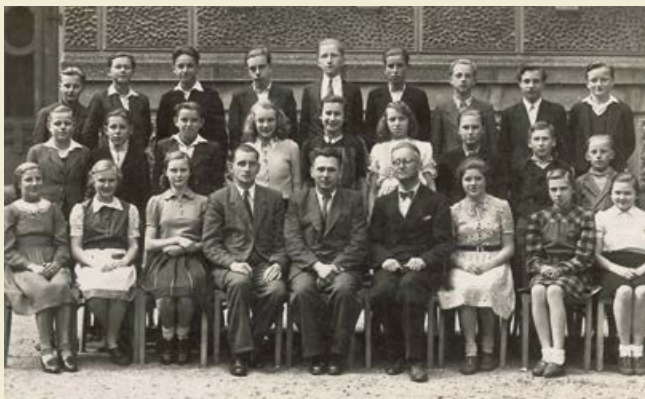
Rjadownja serbskeho gymnazija we Warnočicach, ca. 1948

Wučbna šćežka online w portalu SORABICON