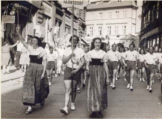
Sorben aus Varnsdorf beim Gesamt-Sokol-Treffen in Prag, 1948