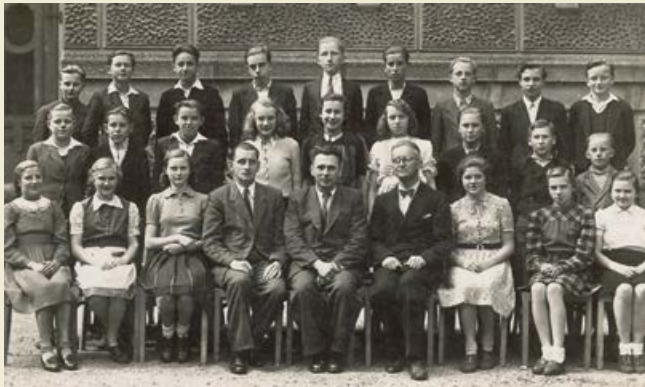
Schulklasse des sorbischen Gymnasiums in Varnsdorf, ca. 1948, Serbski kulturny archiv, Budyšin / Sorbisches Kulturarchiv, Bautzen