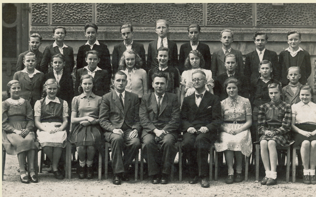
Rjadownja serbskeho gymnazija we Warnočicach, ca. 1948

Wučbna šćežka online w portalu SORABICON