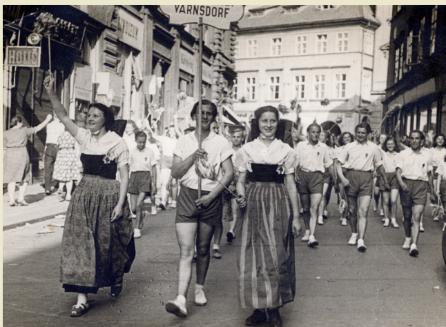
Warnočanscy Serbja na Wšosokotskim zleče w Praze, 1948, priwatne