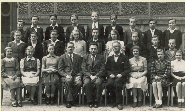
Třída lužickosrbského gymnázia ve Varnsdorfu, cca 1948